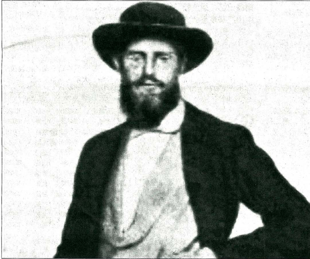
自然学家华莱士于150多年前在新加坡采集到的甲虫标本。